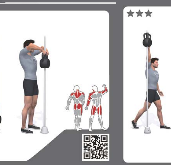
↑ Voorbeeldplaatjes van oefeningen